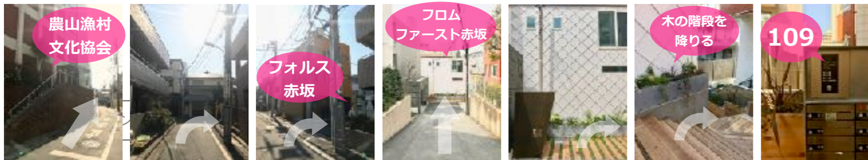
⑦左手に煉瓦の建物「農山漁村文化協会」、コインパーキングを見ながら細い路地を道なりに進みます。